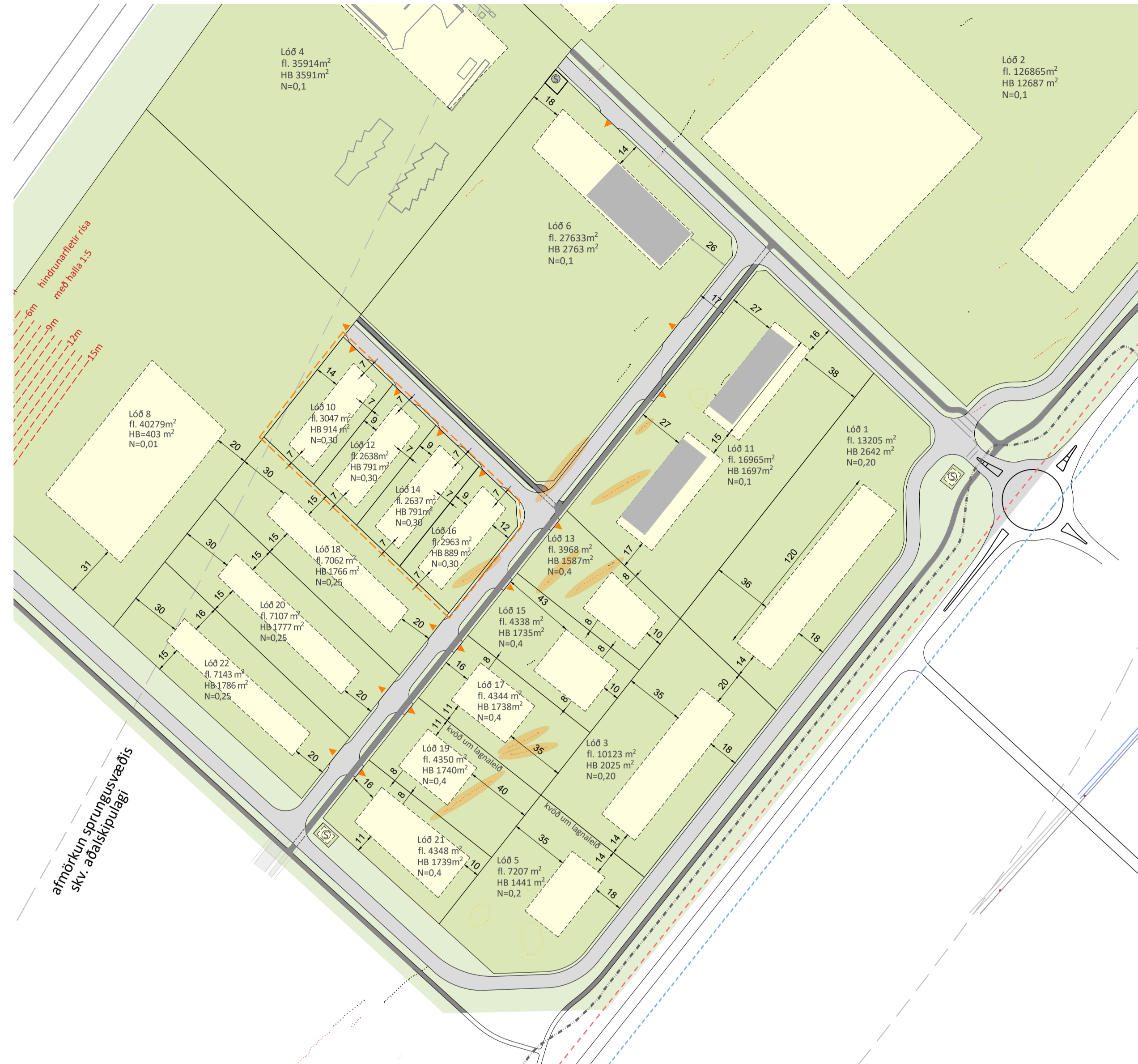
BREYTING Á DEILISKIPULAGI 1:2500