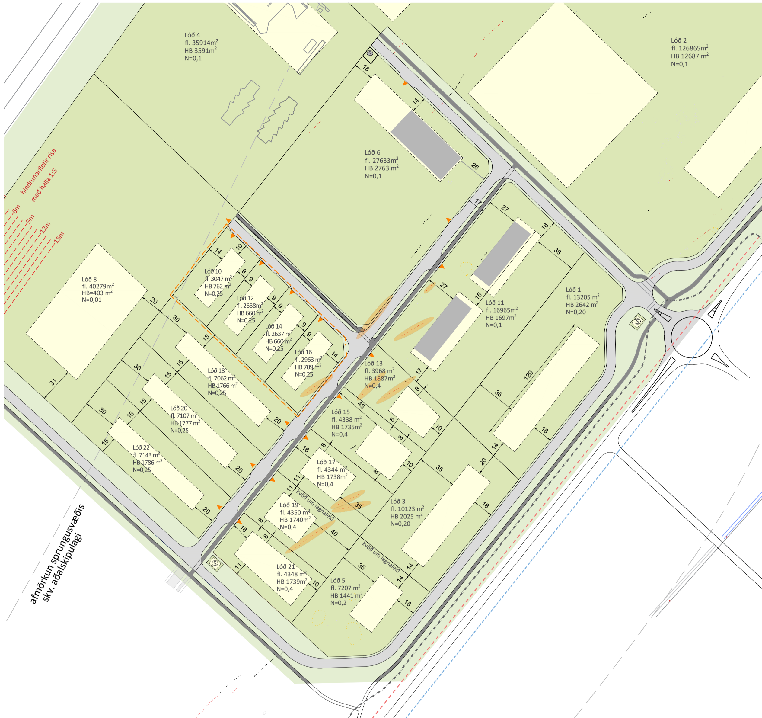
HLUTI AF NÜGILDANDI DEILISKIPULAGI SAMÞYKKT Í BÆJARSTJÓRN ÁRBOGAR 22.12.2018, BREYTT SEP 2014, MAÍ 2017, APRÍL 2021 OG NÓVEMBER 2021